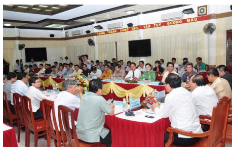
Quang cảnh buổi làm việc giữa Phó Thủ tướng nước Cộng hòa XHCN Việt Nam Nguyễn Xuân Phúc và Phó Thủ tướng nước Cộng hòa DCND Lào Somsavat Lengsavat với lãnh đạo tỉnh Bình Định và các doanh nghiệp Lào