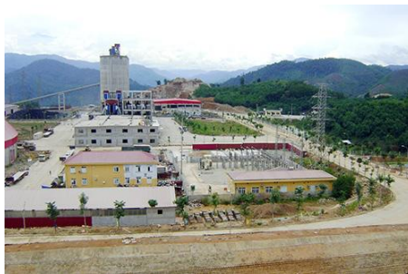
Dự án Nhà máy xi măng Thanh Mỹ là một trong những dự án trọng điểm được hỗ trợ tích cực từ chính quyền địa phương.

qua vẫn còn một số tồn tại, hạn chế, nhất là trong việc chỉ đạo điều hành, sự phối hợp giữa các ngành, các cấp; việc giải quyết thủ tục đầu tư, kiến nghị của DN có nơi, có lúc chưa nhất quán, đồng bộ; công tác giải phóng mặt bằng, bàn giao đất cho nhà đầu tư chưa đúng tiến độ, nhiều trường hợp bị chậm trễ kéo dài; công tác đào tạo lao động chưa đáp ứng yêu cầu các dự án đầu tư; một số dự án đầu tư chậm tiến độ... Mặt khác, công tác cải cách TTHC có lúc, có nơi còn gây khó khăn, một số cán bộ thực thi công vụ còn gây những nhiễu và sự thiếu sâu sát, trách nhiệm của một số cán bộ lãnh đạo, do đó người dân, DN còn phiền hà. Từ đó đã dẫn đến vài chỉ số thành phần trong PCI xếp thứ hạng không ổn định và có điểm số rất thấp.