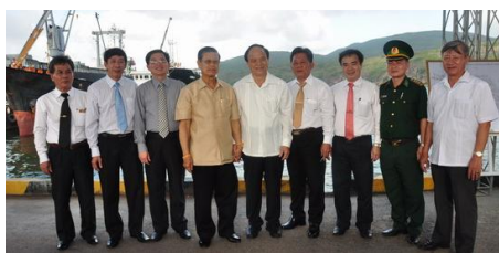
Phó Thủ tướng Somsavat Lengsavat (thứ tư từ trái sang) thăm Cảng Quy Nhơn