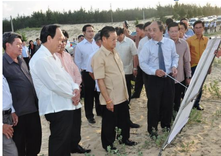
Phó Thủ tướng Somsavat Lengsavat thăm Khu Kinh tế Nhơn Hội