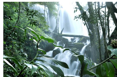
Thác Đắk Glun, huyện Tuy Đức, tỉnh Đắk Nông

Đối với khu du lịch sinh thái thác Đắk Glun ở xã Quảng Tâm, huyện Tuy Đức với tổng vốn đầu tư hơn 11 tỷ đồng, quy mô 91ha, dự án hiện đã cơ bản hoàn thành với hệ thống quán cà phê, đường nội bộ, điện chiếu sáng. Đây là điểm được ngành du lịch xác định là khu vực trọng điểm để phát triển du lịch phía Tây Nam của tỉnh và hỗ trợ tích cực cho việc kết nối tuor Tp.HCM - Đà Lạt - Tà Đùng - Đắk Glun.