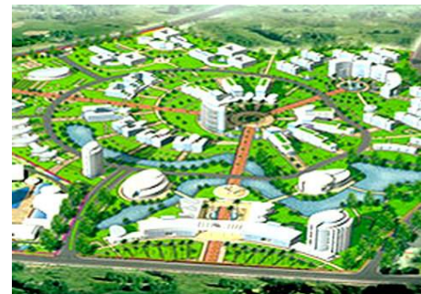
Khu công nghệ cao Đà Nẵng được đề xuất phát triển thành một đô thị mới cốt lõi của Đà Nẵng

cum, thay vì cách quy hoạch phân vùng như hiện nay và định hướng phát triển thành thành phố xanh, thân thiện với môi trường.