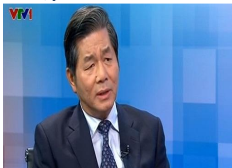
Bộ trưởng Bùi Quang Vinh khẳng định năm 2014 thu hút vốn FDI vẫn đạt khoảng 14 - 15 tỷ USD.

nỗ lực và mong muốn chủ quan, bởi đây là nhà đầu tư nước ngoài. Họ đang chịu rất nhiều tác động, trong đó có tác động từ chính tập đoàn, công ty ở nước sở tại. Việc bị vỡ nợ, sa lầy vào những khó khăn của tập đoàn mẹ khiến họ không đủ khả năng ra nước ngoài đầu tư, phải co cụm lại.