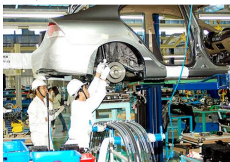
Quảng Nam được xem là có môi trường thuận lợi cho công nghiệp chế tạo vốn là thế mạnh của doanh nghiệp Nhật Bản.

Hệ thống cơ sở hạ tầng kinh tế-xã hội trên địa bàn Quảng Nam thời gian qua cũng từng bước được đầu tư đồng bộ, đáp ứng cơ bản nhu cầu của các nhà đầu tư. Quảng Nam cũng đang thực hiện đồng bộ nhiều giải pháp cải thiện môi trường đầu tư, hỗ trợ doanh nghiệp, cải cách hành chính, triển khai quy chế “một cửa liên thông”, rút ngắn thời gian giải quyết các thủ tục đầu tư.