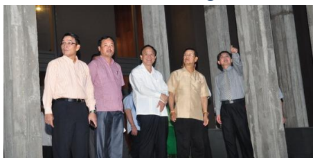
Phó Thủ tướng Somsavat Lengsavat (thứ hai từ phải sang) thăm Trung tâm Quốc tế Giáo dục và Khoa học liên ngành.

Theo chương trình kế hoạch, sáng 2.11, hai Phó Thủ tướng Nguyễn Xuân Phúc, Somsavat Lengsavat, cùng lãnh đạo Phân ban Việt Nam - Lào; lãnh đạo một số bộ, ngành của Trung ương và lãnh đạo tỉnh Bình Định sẽ có cuộc họp xung quanh chương trình hợp tác giữa các tỉnh miền Trung Việt Nam với các tỉnh Trung Nam Lào.