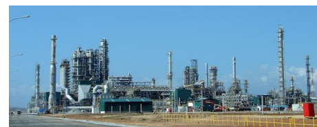
Nhà máy lọc dầu Dung Quất sau khi mở rộng sẽ có quy mô khoảng 8,5 – 9 triệu tấn dầu thô đầu vào/năm so với 6,5 triệu tấn dầu thô/năm hiện tại

Nhà máy lọc dầu Dung Quất sau khi mở rộng sẽ có quy mô khoảng 8,5 – 9 triệu tấn dầu thô đầu vào/năm so với 6,5 triệu tấn dầu thô/năm hiện tại. Với cấu hình công nghệ được đề xuất lựa chọn như hiện nay, quy mô đầu tư nâng cấp mở rộng sẽ nằm trong khoảng 1,8- 2,0 tỷ USD. Theo kế hoạch thì việc mở rộng công suất này cần thời gian từ 60- 78 tháng để hoàn tất.