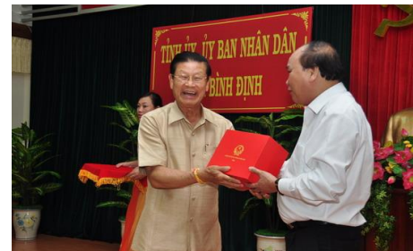
Phó Thủ tướng Nguyễn Xuân Phúc (bìa phải) tặng quà lưu niệm cho Phó Thủ tướng Somsavat Lengsavad