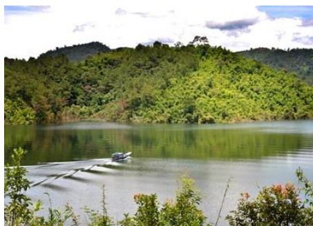
Vùng eo nhỏ trên biên hồ Tà Đùng

Đề khai thác có hiệu quả các tiềm năng du lịch trên địa bàn tỉnh Đắk Nông, thời gian qua tỉnh Đắk Nông đã ban hành nhiều chính sách hỗ trợ, ưu đãi doanh nghiệp trong và ngoài tỉnh vào đầu tư các dự án nhằm thúc đẩy và đưa ngành du lịch tỉnh nhà phát triển mạnh mẽ.