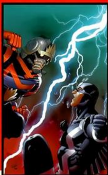
GUARDIÕES DA GALÁXIA #14 À VENDA EM 27/05/09