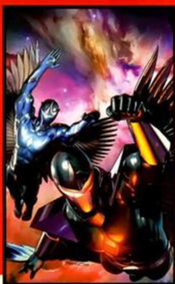
GUERRA DE REIS: ASCENSÃO #2 À VENDA EM 13/05/09