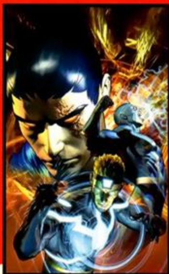
GUERRA DE REIS #3 À VENDA EM 06/05/09