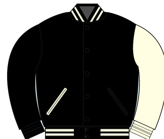
BLACK WOOL w/WHT SLEEVE NW-VARSITYLEATHER-01 レザースリーブ R. $325CDN