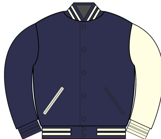
NAVY WOOL w/WHT SLEEVE NW-VARSITYLEATHER-03 レザースリーブ R. $325CDN