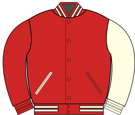
RED WOOL w/WHT SLEEVE NW-VARSITYLEATHER-04 レザースリーブ R. $325CDN

ALTERNATE COLORWAY CHART INQUIRE FOR CUSTOM VARIATION