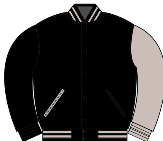
BLACK WOOL w/GREY SLEEVE NW-VARSITYWOOL-01 ウールスリーブ R. $250CDN